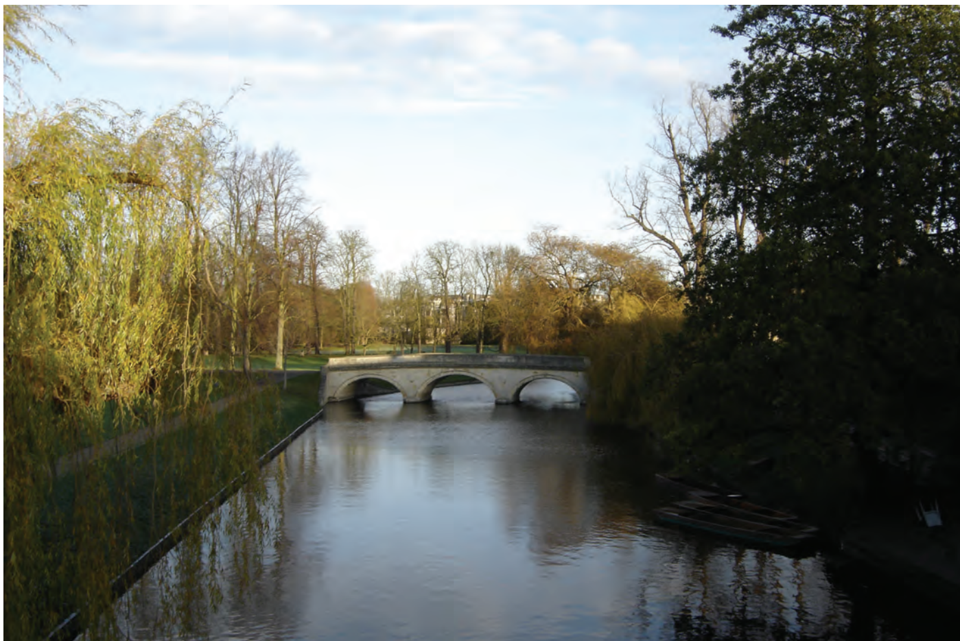
CAMBRIDGE V DECEMBRI 2011