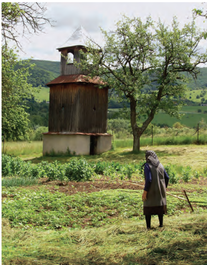
Fotografia z plagátu vydaného k výstave „Jedno miesto - veľa svetov“.