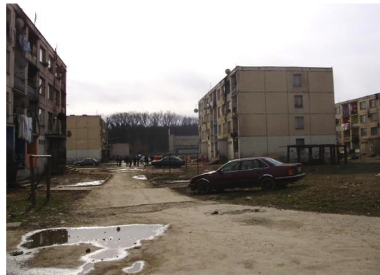
Obr. 1: Sídlisko Luník IX v Košiciach; Obr. 2: Sídlisko Dúžavská cesta v Rimavskej Sobote [5]

Luník IX je dodnes jedným z najvýraznejších príkladov inštitucionálnej segregácie Rómov, pričom ďalšie podobné návrhy predložilo začiatkom 90. rokov mesto Lučenec a Humenné, ktoré v extraviláne svojho mesta navrhovali vybudovať rómske satelitné mestečko s vlastnou samosprávou. V týchto prípadoch sa však navrhované projekty v predloženej forme nikdy nezrealizovali [7], aj keď rómska osada Podskalka pri Humennom sa od roku 1989 zväčšila niekoľkonásobne a to početne aj rozlohovo (viď. fotodokumentácia z terénneho výskumu- Obr. 3).