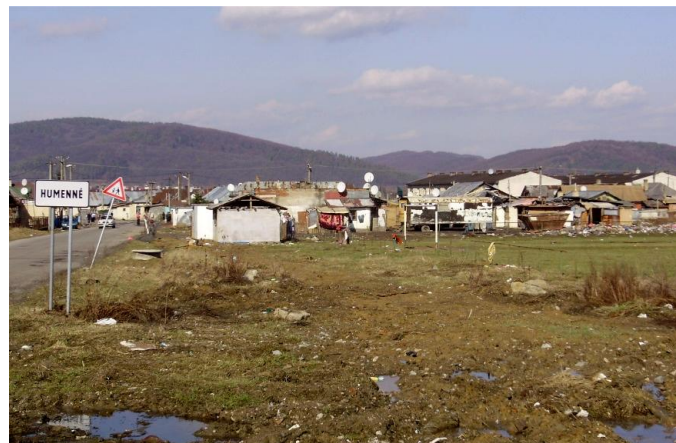
Obr. 3 Osada Podskalka v Humennom [5]

Luník IX je dodnes jedným z najvýraznejších príkladov inštitucionálnej segregácie Rómov, pričom ďalšie podobné návrhy predložilo začiatkom 90. rokov mesto Lučenec a Humenné, ktoré v extraviláne svojho mesta navrhovali vybudovať rómske satelitné mestečko s vlastnou samosprávou. V týchto prípadoch sa však navrhované projekty v predloženej forme nikdy nezrealizovali [7], aj keď rómska osada Podskalka pri Humennom sa od roku 1989 zväčšila niekoľkonásobne a to početne aj rozlohovo (viď. fotodokumentácia z terénneho výskumu- Obr. 3).