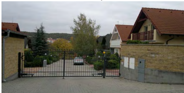
Obr. 4.6: Uzavretá komunita v mestskej časti Lamač

Lokalita Lamač je pôvodná vidiecka obec, ktorá bola pričlenená k Bratislave a počas socialistickej výstavby tam vyrástlo nevelké panelové sídlisko. Veľkú časť Lamača tvorí pôvodná individuálna zástavba s rodinnými domami, ktorá poskytuje pokojné bývanie vidieckeho charakteru v prostredí vnútorného mesta. Pôvodná zástavba je tu dopĺňaná novými domami, prípadne súborom domov, medzi ktorými sa nachádza aj uzavretá komunita (obr. 4.6). Plot, ktorý oddeľuje súbor 12 architektonicky totožných domov, ktoré sa nevelmi líšia od ostatnej zástavby predstavuje znak bezpečia a ochrany súkromného vlastníctva.