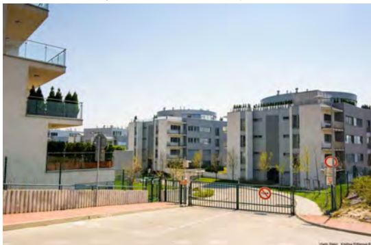
Obr. 4.3: Matejkova ulica na Dlhých Dieloch