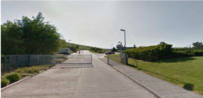
Obr. 4.7: Uzavretá komunita v mestskej časti Záhorská Bystrica