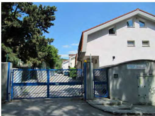
Obr. 4.4: Karlova Ves - uzavretá komunita Pernecká