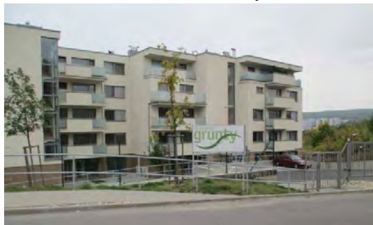
Obr. 4.2: Uzavretá komunita Grunty v časti Staré Grunty v Karlovej Vsi

V mestskej časti Nové mesto je tradične obľúbenou lokalita Koliba, ktorá predstavovala bývanie pre majetnejšie skupiny obyvateľstva už v staršej histórii mesta. Taktiež dobrá dostupnosť do centra, blízkosť Karpát, prevládajúca vilová zástavba sú typickými črtami tejto lokality. V lokalite je prevažne individuálna rezidenčná zástavba, bez typických socialistických panelových bytov. Nachádza sa tu tzv. “dedinka boháčov” – Trinásťta ulica (obr. 4.5), ktorá má všetky znaky uzavretej komunity.