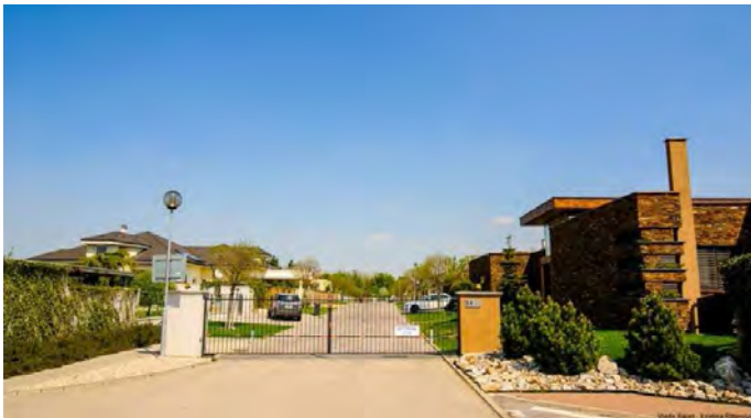
Obr. 4.8: Septimiova ulica v mestskej časti Rusovce

Hoci pri takejto dobrovoľnej priestorovej izolácii bohatšieho obyvateľstva je používaným najmä pojem separácia, Sâgeatâ et al (2010) v súvislosti s uzatváraním sa v ohradených areáloch používajú pojem finančná segregácia. Popri rozsiahlych skupinách obyvateľstva, ktoré čelia vážnym sociálnym problémom ako nezamestnanosť, nedostatočne vybudovaná infraštruktúra, vysoká kriminalita, stojí na opačnej strane vysokopříjmové obyvateľstvo, ktoré má tendenciu migrovať do uzavretých mestských spoločenstiev, elitných areálov s vysokým štandardom, ktoré si môžu dovoliť len bohatí ľudia a oddeliť sa tak od zvyšku populácie.